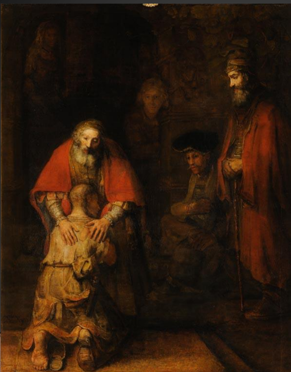
《浪子回头》 伦布朗 1661-1669